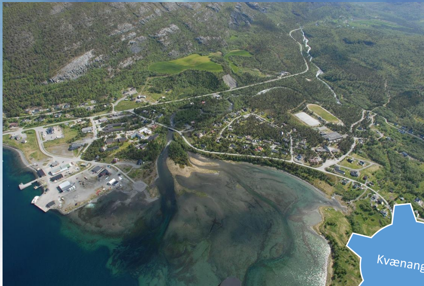
nve.no/Storelva i Burfjord